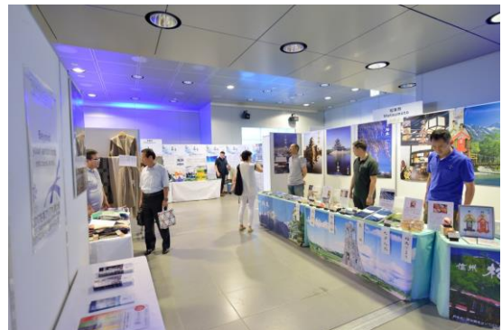
겨울견본시장 (2016년 7월 일본 삿포로)