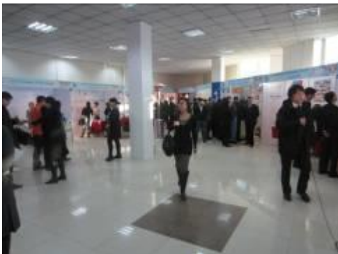
겨울견본시장 (2012년 1월 몽골 울란바토르)

시장회의를 개최하는 도시는 회의와 더불어 겨울견본시장을 개최할 수 있습니다. 개최 도시 및 회원 도시의 기업이나 단체가 중심이 되어 출품하고, 겨울과 눈에 관련된 기자재와 제품 전시를 비롯하여 다양한 기술을 소개하는 등 겨울 도시에 의한 경제교류의 공간으로서 중요한 역할을 하고 있습니다.