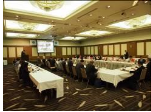
2015 년 실무자회의 (2015 년 7 월 일본 삿포로)

회의는 원칙적으로 2년에 한 번 사무국 도시에서 개최하며, 다음 시장회의 개최 계획안과 시장회의에서 시장들이 논의할 테마를 선정하고, 시장회 운영 등에 대해 실무자들이 논의합니다.