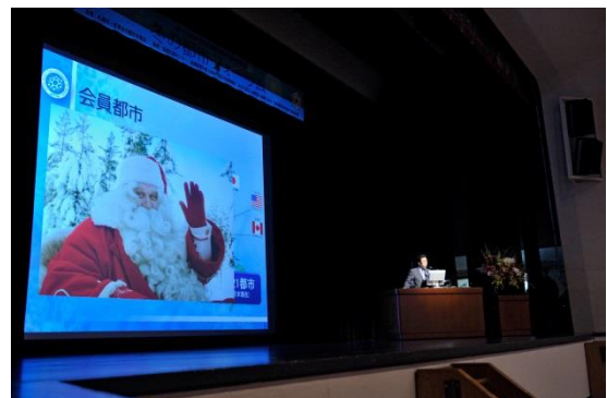
겨울도시포럼 (2016년 7월 일본 삿포로)

시장회의를 개최하는 도시는 회의와 함께 겨울 도시 포럼을 개최할 수 있습니다. 여러 분야의 전문가와 학술연구자 및 시민들이 겨울의 생활양식과 바람직한 도시 운영 등에 대하여 발표를 하고 일반 참가자와 함께 의견을 교환합니다.