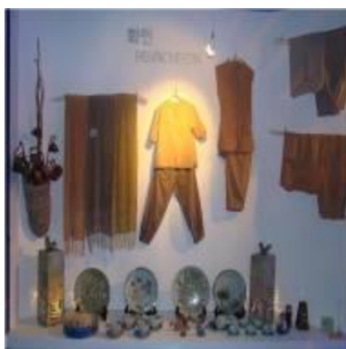
전통의상 및 공예품을 전시