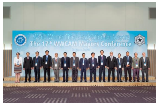
제 17 회 세계겨울도시시장회의 (2016 년 7 월일본삿포로)

회의 개최 도시는 입후보한 회원 도시들 중에서 총회 결의에 의해 결정됩니다. 2018년 제18회 회의는 중국 선양시에서 열리며, 2020년 제 19회 회의는 핀란드 로바니에미시에서 개최하기로 결정되었습니다.