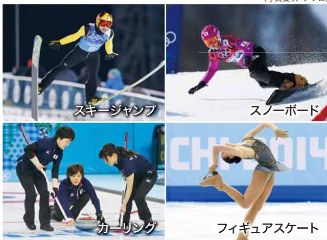
【他にも】スピードスケート、ボブスレー、リュージュ、アイスホッケーなど