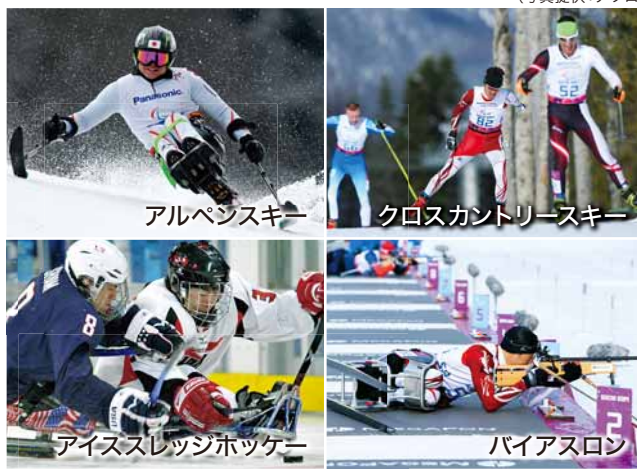
【他にも】車いすカーリング