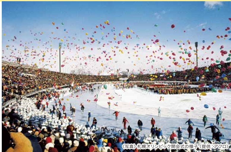
《写真》札幌オリンピック開会式の様子

北海道で初となる高速道路「道央自動車道」と「札幌自動車道」の一部が開通したほか、オリンピックの開会式・閉会式が行われた真駒内地域と都心を結ぶ「地下鉄南北線」も開業。地下街も整備されました。