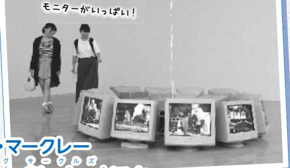
モニターがいっぱい！

普段はごみとして捉えられるようなものにスポットを当てた作品を複数展示。捨てられたパソコンを再利用するために分解する様子が、パソコンのモニターに映し出される作品などが並びます。