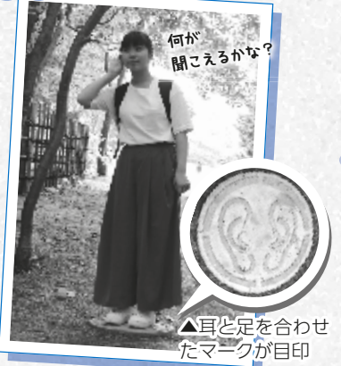
何が聞こえるかな？ ▲耳と足を合わせたマークが目印

作者が実際に野外美術館を歩き、自然の音を聞くためのポイントを10カ所選んでマークを設置。見つけたら、その上に立って耳を澄ませてみて。