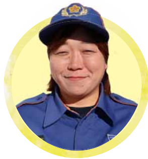
清田消防団 清田分団

自宅近くで火災が発生した際、地域における消防活動の重要性を感じ、入団を決意しました。人間関係の輪が広がることも消防団の魅力です。ぜひ、一緒にまよたのまちを守りませんか。