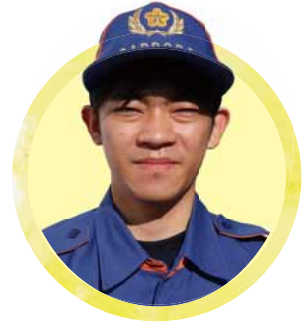
清田消防団 里塚分団

救命講習を通して、一歩踏み出す勇気の大切さを伝えることにやりがいを感じています。楽しく技術を身に付けてもらえるような工夫をして、身近な消防団員でいるように心がけています。