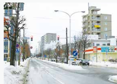
▲現在の平岸通（令和6年）