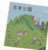
▲月寒公園のパンフレット