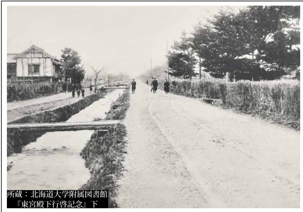
『東宮殿下行啓記念』下