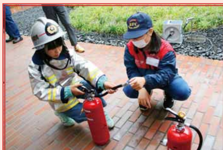
防災イベントで消火器の使い方をレクチャー!