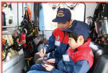
消防車に乗り、車内のさまざまな機材について、熱心に勉強中