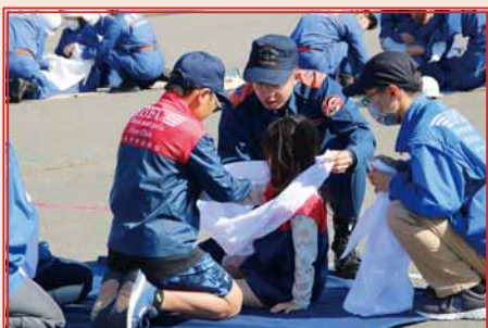
大人の消防団員と一緒に、応急手当の訓練に参加