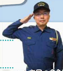
消防吏員のまちづくりセンター所長は市内で鉄東だけ！

地域を東西に貫く「ななめ通り」（道道花畔札幌線）。伏籠川沿いの獣道を人が道路として使うようになったのが始まりといわれています。古くから栄えた通りの周辺には、ノスタルジックな光景が広がっています。