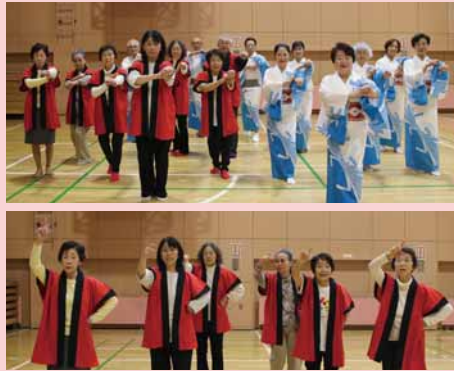
▲音頭の練習風景、下写真は新曲の振り付けを練習中

—どんな活動をしているの？ 今年夏祭りが復活したので、地区で行われたお祭りなどに参加しました。4年ぶりに行われた「屯田夏まつり」では子どもも大人も100人以上が屯田音頭を踊ってくれて大変盛り上がりました。また、月1回の定例講習会を行い、新しい会員を募っています。連合町内会女性部にもご協力いただき、若い世代の方たちにつないでいくにはどのような形だと受け入れてもらえるのか、試行錯誤しながら活動しています。 —新しい取り組みをしているの？ コロナ禍に1年かけて新しい音頭を作りました。作曲を屯田在住の方