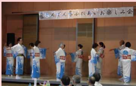
▲「屯田ふれあいお楽しみ会」でのステージの様子

—屯田音頭について教えてください。 屯田への入植100年を祝って昭和63年に作られた、オリジナルの音頭です。今年が音頭ができて35年の節目の年です。音頭を広めるため平成8年に「音頭を広める会」が発足し、その後「屯田音頭の会」と名を改め、現在55名で活動しています。