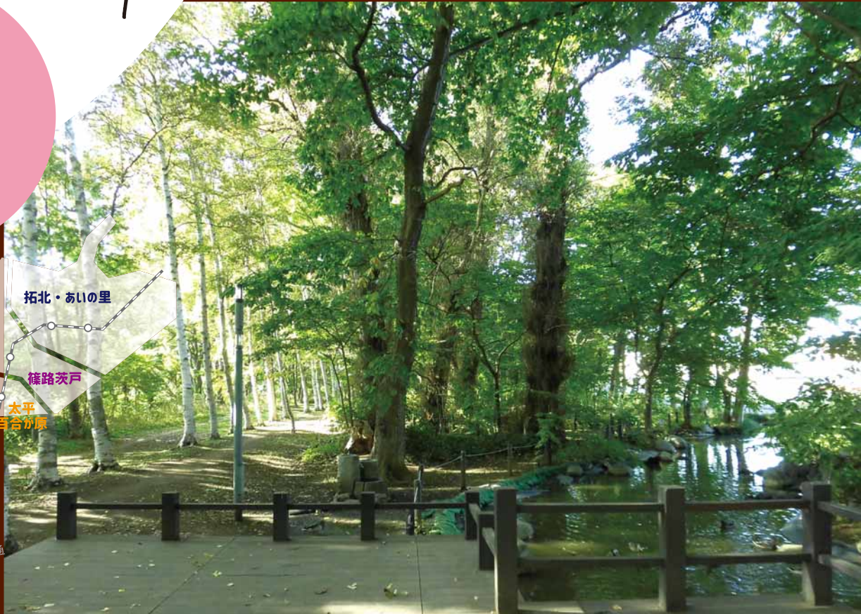
▲人々の憩いと安らぎの場になっている「屯田防風林」(さっぽろ・ふるさと文化百選)