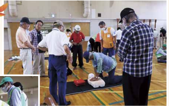
自動体外式除細動器(AED)を使った心肺蘇生訓練

9月4日(月)、南小学校(南31条西9丁目)で南区防災訓練が行われました。同校の児童や藻岩下地区連合会の地域住民、南消防署、南区災害防止協力会など防災関係機関の職員、合わせて約450人が参加し、災害時の行動を確認しました。