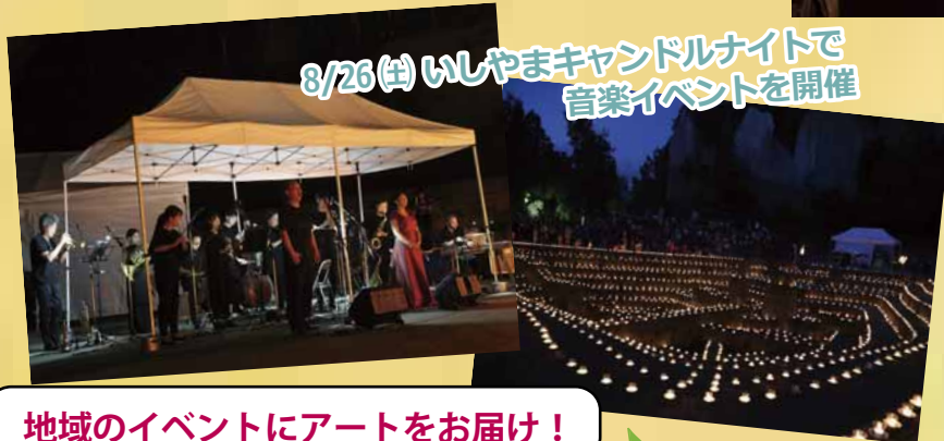
8/26(土) いしやまキャンドルナイトで 音楽イベントを開催