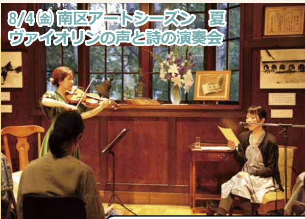
8/4(金) 南区アートシーズン 夏 ヴァイオリンの声と詩の演奏会

南区には、札幌芸術の森や石山緑地など、多くの芸術関連施設があります。また、その雄大な自然に引かれて多様なジャンルのアーティストが区内に活動拠点を構え、創作活動を行っています。南区ゆかりのアーティストと共に、アートに恵まれた環境にある南区の魅力を伝え、活気あふれるまちづくりを目指すのが、ミナミナク・アートプロジェクトです。