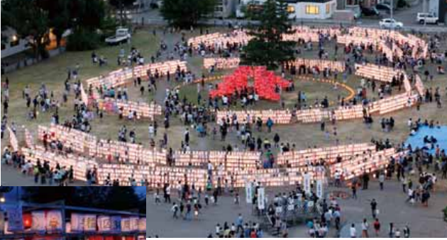
旧てっぽく・ひろば会場での最後の開催となった第28回(令和元年)。会場は多くの人でにぎわいました。