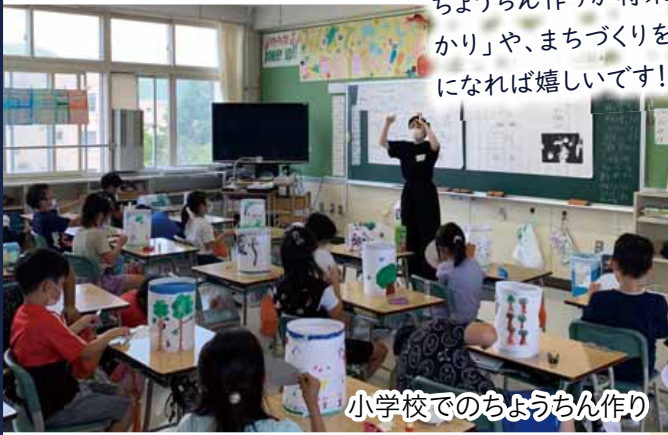
小学校でのちょうちん作り

ちょうちん作りが将来の「ていね夏あかり」や、まちづくりを考えるきっかけになれば嬉しいです！