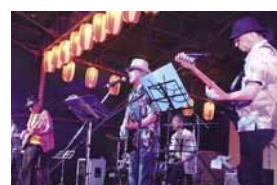
※写真は 2019 年開催時の様子