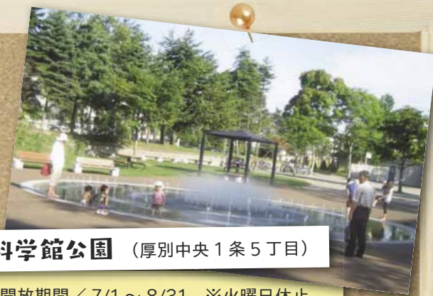
科学館公園 （厚別中央1条5丁目）

開放期間／7/1～8/31 ※火曜日休止 9時30分～16時30分 水の吹き出しパターンが3種類あり、水深が3cmと小さな子どもでも楽しめます。