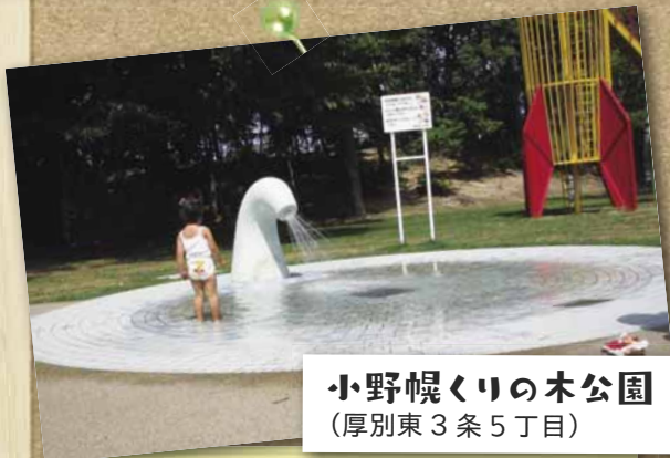
小野幌くりの木公園 （厚別東3条5丁目）

開放期間／7/1～8/31 ※火曜日休止 9時30分～16時30分 水の吹き出しパターンが3種類あり、水深が3cmと小さな子どもでも楽しめます。