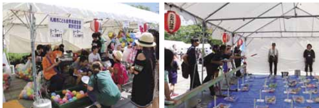
▲子どもから大人まで楽しめる出店が盛りだくさん!