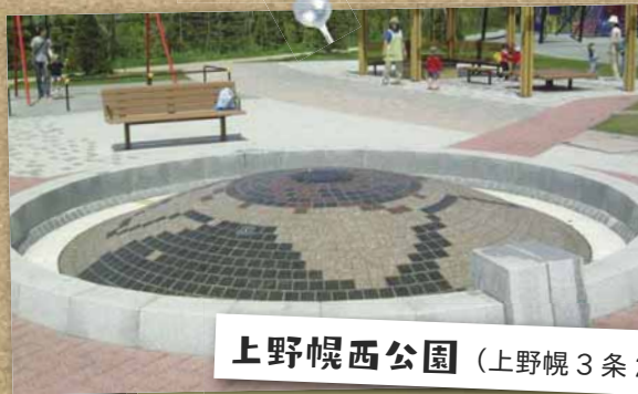
上野幌西公園 （上野幌3条2丁目）

開放期間／7/3～8/21 ※雨天中止 9時30分～16時30分 長さ約16m、高さ5mのウォータースライダーとこれに続く遊水池が特徴です。