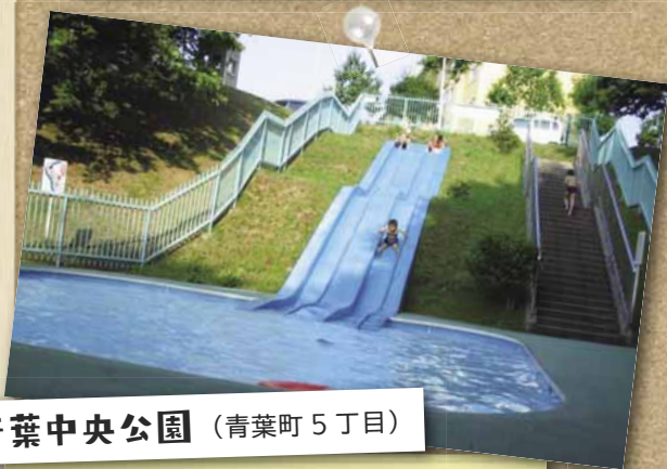
青葉中央公園 （青葉町5丁目）

開放期間／7/1～8/31 9時30分～16時30分 面積112平方メートル、水深10～30cmの広い遊水路が設置されています。