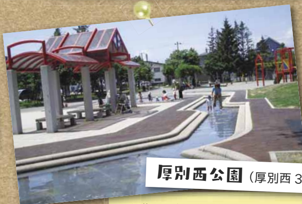
厚別西公園 （厚別西3条3丁目）

開放期間／7/1～8/31 9時30分～16時30分 5分に一度、噴き出し口からシャワー状に水が出て楽しめます（約1分間）。