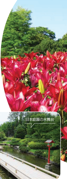
日本庭園の水舞台