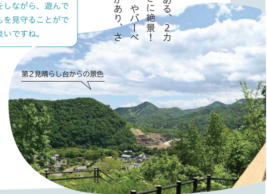
第2見晴らし台からの景色

所在地 西区福井423 交通機関 地下鉄東西線琴似駅からジェイ・アール北海道バス(琴41)乗車、「五天山公園」下車ほか 駐車場 544台。無料 詳細 同管理事務所 ☎662-2424