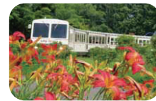
▲園内の約1.2kmをゆっくりと巡るリリートレイン

※6人以上の場合は組み合わせて購入例) 6人の場合⇒800円(5人)+250円(1人)=1,050円 ※未就学児、障害者手帳を持つ方などは無料