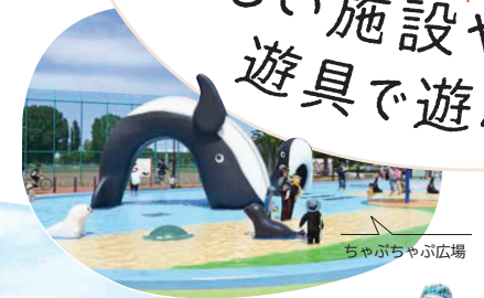
ちやぶちやぶ広場