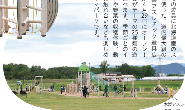
木製アスレチック遊具広場

全ての遊具に北海道産の木材を使った、道内最大級の「木製アスレチック遊具広場」が4月29日にオープン！農と食がテーマの25種類の遊具で遊べます。季節ごとのイベントや野菜の収穫体験、動物との触れ合いなども楽しめるテーマパークです。