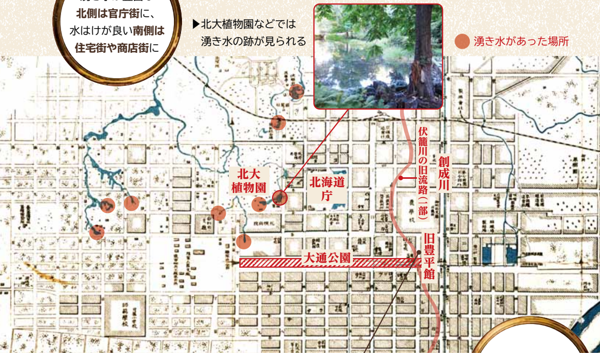
「札幌市街之図」(1899(明治32)年)