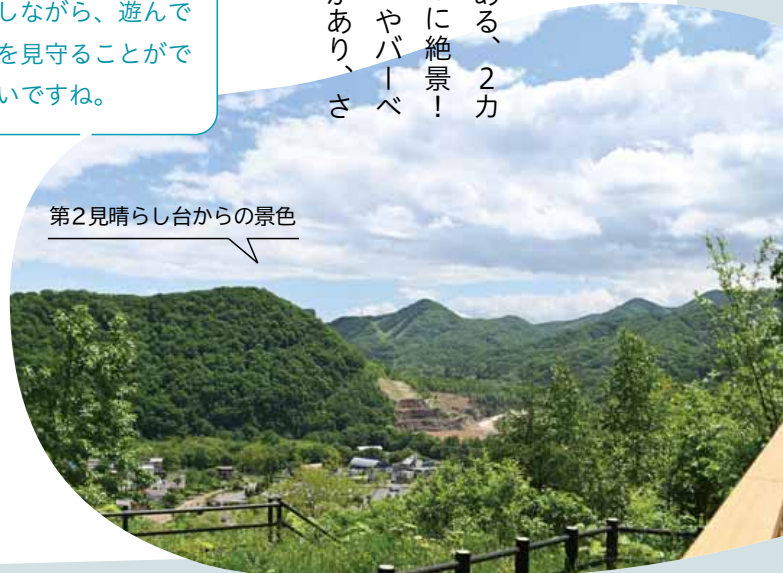
第2見晴らし台からの景色

標高約303mの五天山の中腹にある、2カ所の見晴らし台からの眺めは、まさに絶景! 大型遊具を備えた「子どもの遊び場」やバーベキューが楽しめる「炊事広場」などがあり、さまざまな過ごし方ができます。