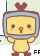
PRキャラクター ビーくん