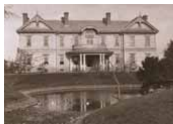
豊平館(大正期)