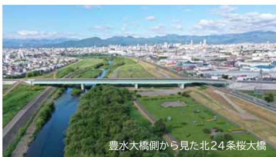
豊水大橋側から見た北24条桜大橋