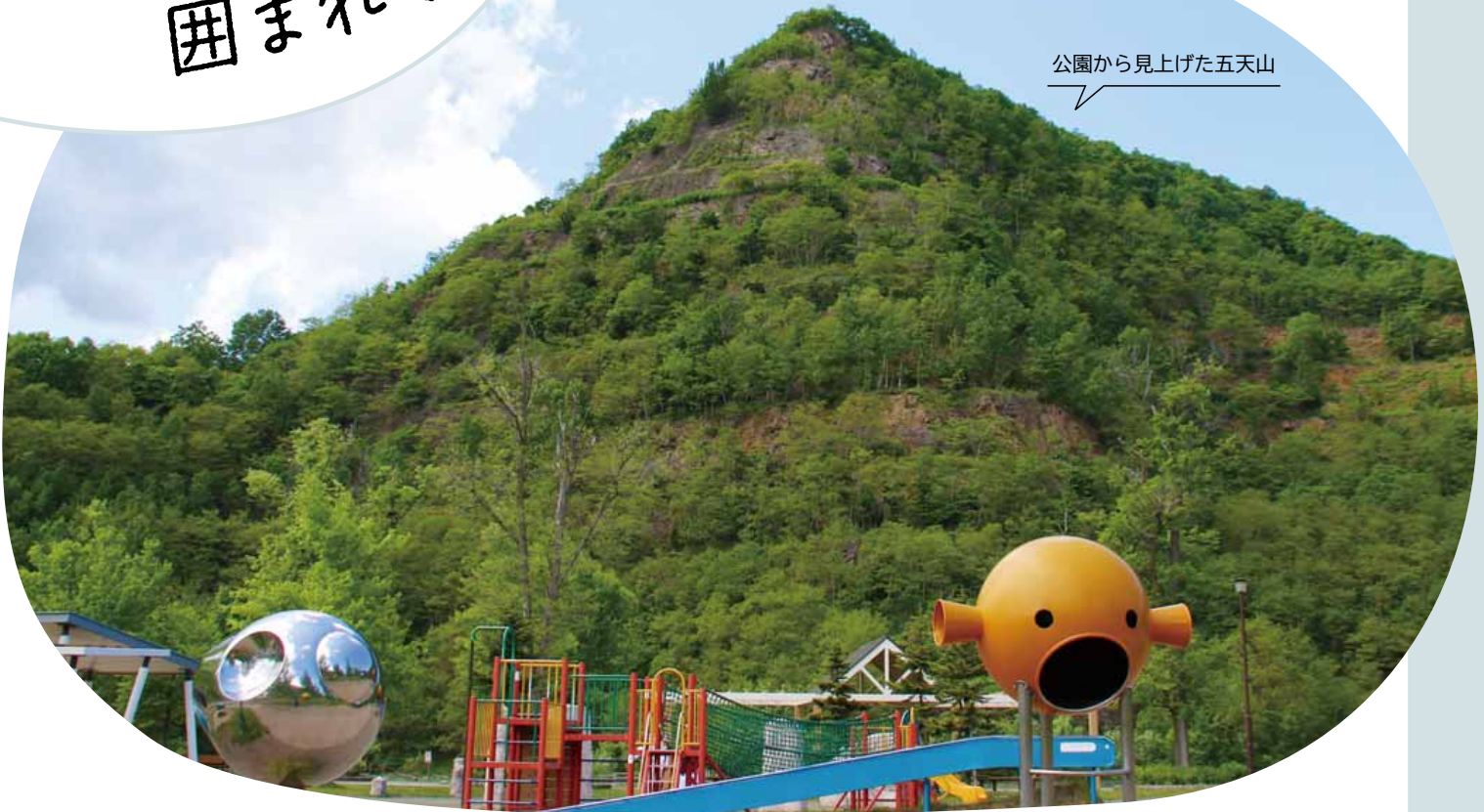
公園から見上げた五天山