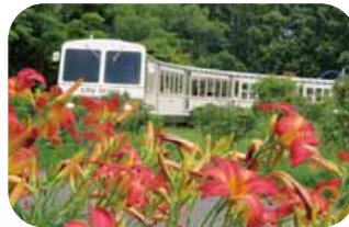
▲園内の約1.2kmをゆっくりと巡るリリートレイン

約25ヘクタールの敷地に、6400種類ほどの植物が育てられている公園。「世界の百合広場」では、8月中旬まで約100種類のユリが咲きます。中でも、中央花壇の中に設けられた通路から見渡す、色とりどりのユリに囲まれた景色は必見です。また、「日本庭園（世界の庭園内）」の水舞台では、水面に映る美しい緑の風景を楽しめます。