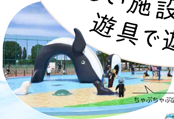
ちゃぶちゃぶ広場

4月13日にリニューアルオープンした「ガリバーひろば」には、ガリバー旅行記の物語をモチーフにした遊具が盛りだくさん。遊具のそばには、水が出るかわいらしいクジラの親子やペンギンなどのオブジェがお出迎えする、水深の浅い水遊び場「ちゃぶちゃぶ広場」があります。