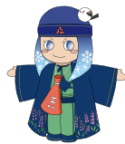
北海道高校生活動イメージキャラクターピリカ

高校生の夏のスポーツの最高峰、高校総体(インターハイ)を36年ぶりに北海道で開催。札幌では、7/24(月)~8/21(月)に6つの会場で計11種目が行われます。日本一を目指す高校生が繰り広げる熱戦の数々をお見逃しなく!