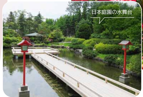
日本庭園の水舞台

利用日時 世界の庭園は11/5(日)までの8時45分～17時15分（入園は16時45分まで）。リリートレインの運行は10/29(日)まで。7、8月のリリートレインの始発は10時、最終は平日15時30分、土・日曜、祝日15時40分