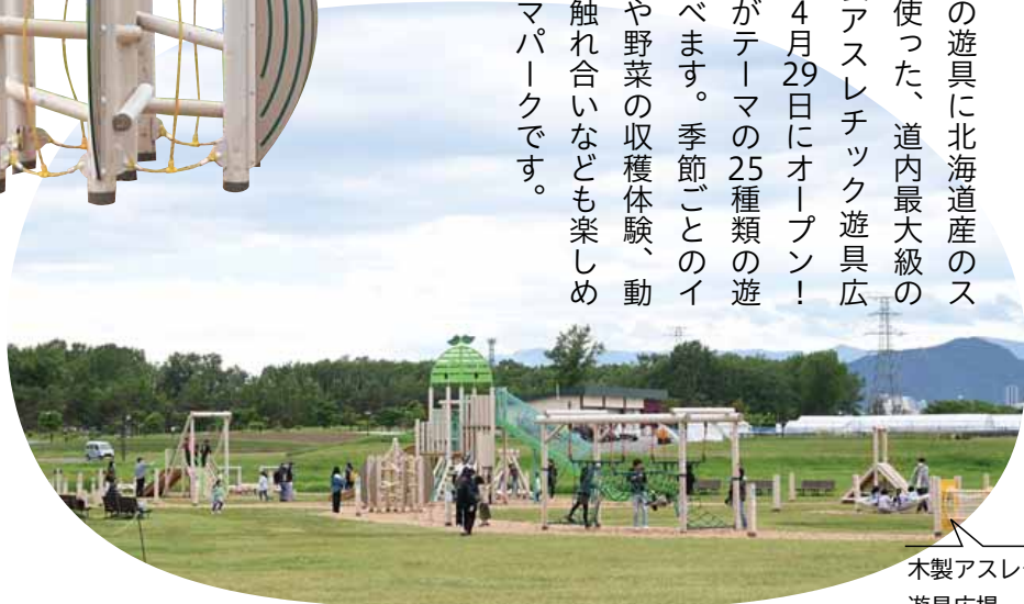
木製アスレチック遊具広場