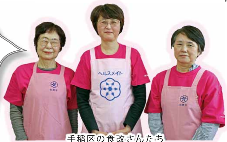
手稲区の食改さんたち