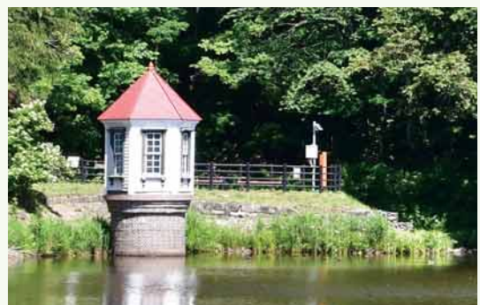
▲旧西岡水源池取水塔（令和4年） 平成13年に国指定の登録有形文化財となる。