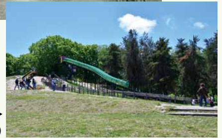
月寒公園▶ (令和 4 年)