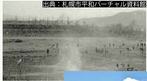
▲歩兵第二十五連隊射撃場

野球場や大型遊具などが設置され、多くの人でにぎわう月寒公園も、元は軍所有の土地で、小演習場や射撃場として使用されていました。明治 43 (1910) 年、軍から小演習場を譲り受けた豊平町はこの土地を公園にしました。戦後、手つかずで荒れていた公園は、地元有志と町により、散策路の改修やあずまの設置などの整備が進められ、昭和 36 (1961) 年に総合公園として開園。その後もさまざまな整備が行われ、現在の姿となり、市民の憩いの場として大切にされています。