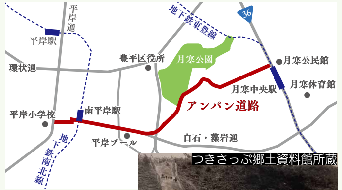
アンパン道路整備の様子▶

明治 43 (1910) 年、豊平町役場の月寒移転に伴い、月寒と平岸をつなぐ道路を造ることが決まりました。しかし、道路予定地は高低差が激しく、水田の埋め立てが必要であったことなどにより作業は難航しました。そこで、豊平町長が連隊へ道路整備の助力を依頼します。住民の奉仕と軍隊の協力により、道路はわずか 4 カ月という早さで完成。作業を手伝った兵隊へ毎日アンパン 5 個が支給されたことから、親しみを込めて、この道を“アンパン道路”と呼ぶようになりました。