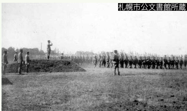
▲練兵場の様子 (大正 11 年)