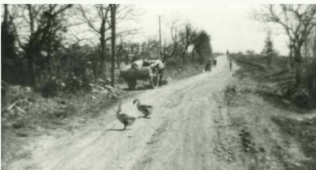
▲水源池通（昭和30年頃）

月寒は台地になっており、水量が豊富ではないところに大人数を抱える兵営が設置されたため、水の確保は非常に重要な課題でした。明治41（1908）年に歩兵第二十五連隊が軍用として月寒水道を造ることとなり、西岡水源池から軍施設まで水道管を引きました。完成後は兵舎や軍の病院の他、小学校などに水が供給されました。この工事の際、資材を運ぶために整備した道が、後の水源池通となっています。西岡水源池は昭和46（1971）年に白川浄水場が通水するまでの間、重要な水源として活用されました。