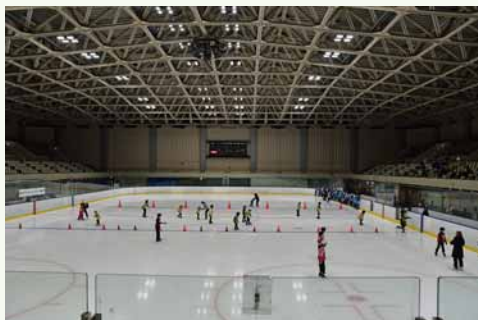
▲月寒体育館 (令和 4 年)