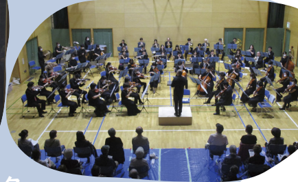
西区文化フェスタ