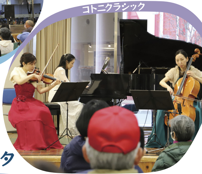
コトニクラシック