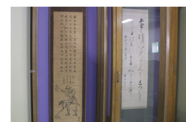
▲松本判官の掛け軸(左)