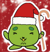
西区環境キャラクター さんかくやまベエ