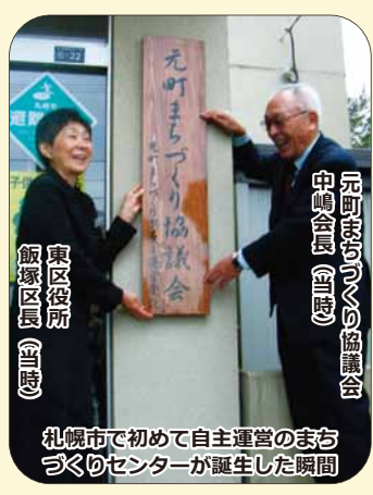
東区役所 飯塚区長（当時）

東区の昔を振り返る「東区今昔」。今月は、札幌市で初めて自主運営化となった「元町まちづくりセンター」の昔を紹介します。元町まちづくりセンターは、平成 20 年（2008 年）10 月 1 日に、市内に 87 カ所あるまちづくりセンターで初めて、地域住民でつくる「元町まちづくり協議会」による自主運営に移行しました。元町地区では、地域で子どもたちを育むことを重点に、子どもの安全・安心、健全育成や多世代交流など、一丸となってまちづくりを進めています。 ※元町まちづくり協議会は、平成 29 年（2017 年）5 月に元町連合町内会と組織統合し、「元町まちづくり連合会」が誕生しました。