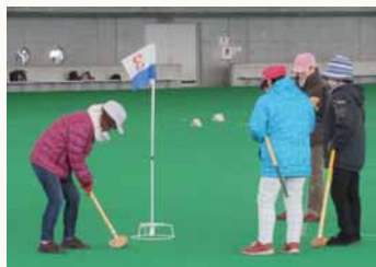
グラウンドゴルフ

グラウンドゴルフは、屋内でできるゴルフに似た競技で、エリア内に設置されたホールポストにボールを入れます。健スポでは全6コースをお楽しみいただけます。