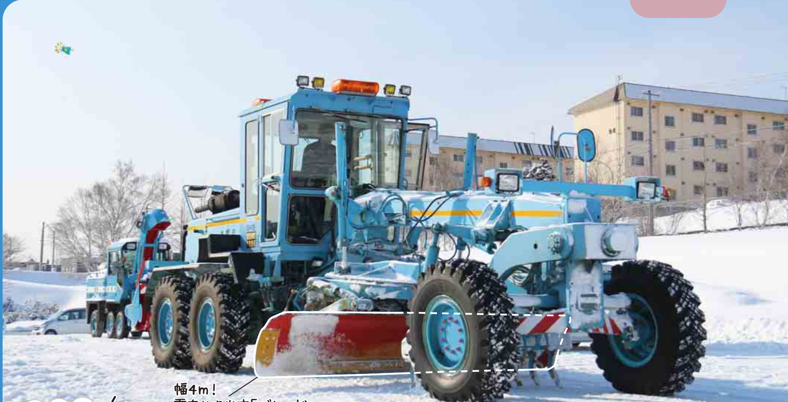
幅4m! 雪をかき出す「ブレード」