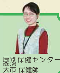
厚別保健センター 大市 保健師