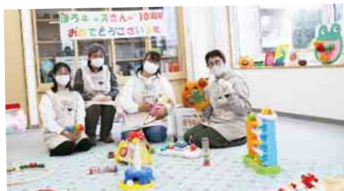
上野幌の「ぼろキッズ」では8名のスタッフがそれぞれの経験を生かして活躍しています

地域の子育てサロンは、乳幼児が安心して遊べる場所として運営されています。ここでは、地域ならではの情報の提供や、親子同士の交流のきっかけづくり、利用者からの相談など、ボランティアによるさまざまな支援が行われています。