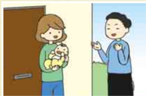
◀地域に気になる親子がいれば、積極的に関わりを持ちます

主任児童委員は、「地域の住民」として、悩みを抱える子育て世帯に寄り添い、関係機関と連携しながら、解決の糸口をつかむ手助けをしています。