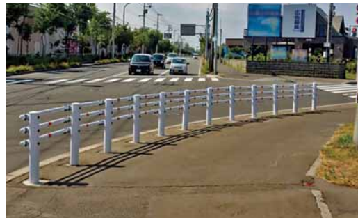
▲斜め横断を減らすために設置された柵

土木センターでは、北海道警察や札幌市建設局と連携して、事故の発生割合が高いとされた箇所を改修しています。斜め横断が多い交差点への乱横断防止柵の設置や、一時停止線の近くに減速を促す路面標示を敷くなど、事故を未然に防ぐ対策を行っています。