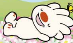
手稲区マスコットキャラクター ていね