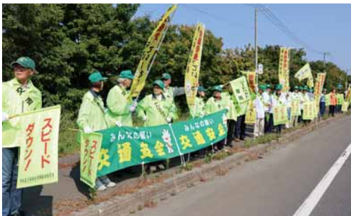
▲ 2019年9月の街頭啓発の様子