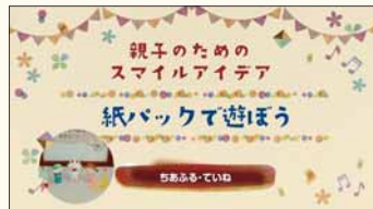
保育士が作成した動画の画面イメージ