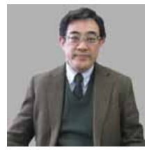
北海道大学大学院地球環境科学研究院 教授 山中 康裕氏