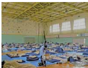
▲過去の災害時の避難場所の様子（琴似小学校）

災害から身を守るため緊急に避難する場所や施設のことで。その中でも、滞在スペースがある施設（西区では小中学校や西区体育館）については、自宅へ戻れなくなった被災者が一時的に滞在する「指定避難所(基幹)」を兼ねています。