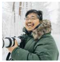
写真家 いのうえ ひろき 井上 浩輝氏