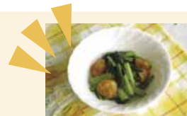
小松菜とえびの変わりソテー

「小松菜農園を見てみよう！小松菜料理を作ってみよう！」を作成し公開しました。小松菜栽培の様子や小松菜料理の調理動画を見ることができます。