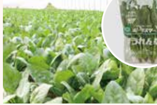
ホウレンソウ「ポーラスター」