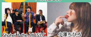
Shohei & the MUSIC