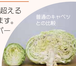
普通のキャベツとの比較

大球は毎年10月ごろに収穫され、スーパーや道の駅などで販売されるほか、ニシン漬けなどの漬物や、市内チェーン店のお好み焼きなどに使われます。