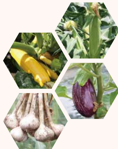
川瀬農園では少し珍しい品種も栽培