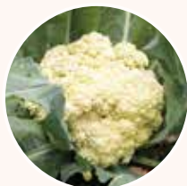
カリフローレ (カリフラワーの一種)