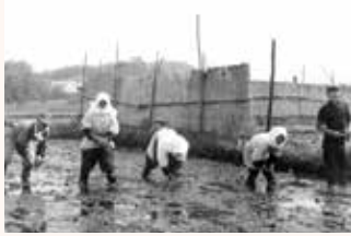
昭和30年ごろの田植えの様子

現在では、30戸ほどの農家が、野菜をはじめ果物・花・卵・キノコ類など、さまざまな農産物を生産しています。