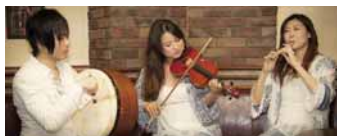
▲Notes of North

【内】入場無料のクラシックとアイリッシュ音楽のコンサート。札幌で活躍する演奏家グループのランス室内楽団とNotes of North