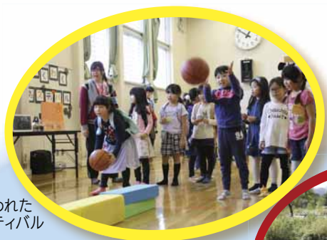
▶西野児童会館で行われたハロウィーンフェスティバル