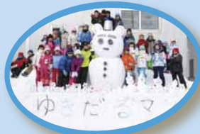
▼力を合わせて西野まちづくりセンターの前に大きなゆきだるまを作りました