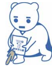
札幌市雪対策キャラクター ゆきだるマン

地下鉄・JR駅周辺の人通りの多い交差点などに、砂箱滑り止め材(砂)が入っています。つるつるを設置しています。つるつる路面の状態を見掛けたときは、自分のため、また、後から通る人のために砂まきにご協力をお願いします。