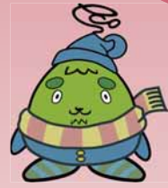
西区環境キャラクター さんかくやまベエ

編集／西区役所総務企画課広聴係 〒063-8612 西区琴似2条7丁目1-1 ☎641-6925 ㊚641-2405