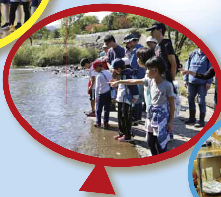
▲琴似発寒川でサクラマスの生態について勉強しました