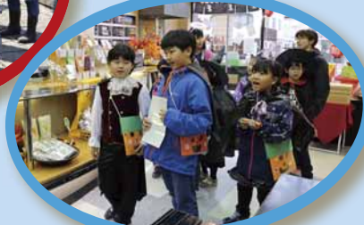
▲ハロウィーンの仮装をして琴似商店街の大人たちを驚かせて回りました