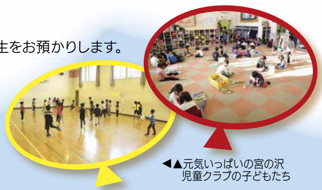
◀元気いっぱい宮の沢児童クラブの子どもたち

※1月号の広報さっぽろ（全市版・札幌市からのお知らせ）にて、令和2年度の申し込みスケジュールについてご案内します。