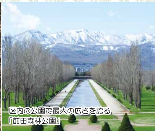
区内の公園で最大の広さを誇る「前田森林公園」