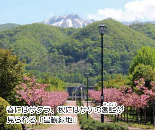
春にはサクラ、秋にはサケの遡上が見られる「星観緑地」