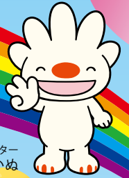
手稲区マスコットキャラクター ていめ