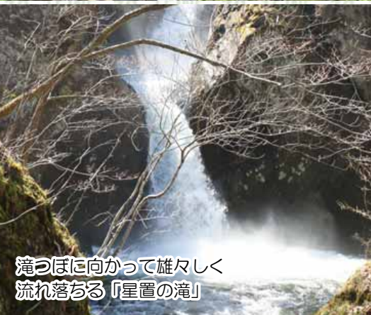
滝つぼに向かって雄々しく流れ落ちる「星置の滝」