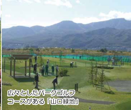
広々としたパークゴルフコースがある「山口緑地」