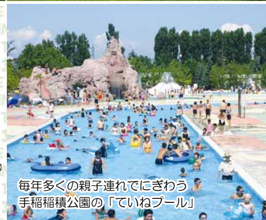
毎年多くの親子連れでにぎわう手稲稲積公園の「ていねプール」