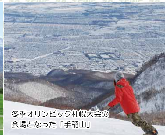
冬季オリンピック札幌大会の会場となった「手稲山」