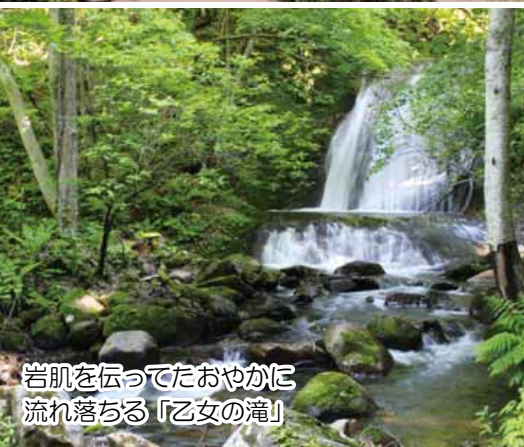
岩肌を伝ってたおやかに流れ落ちる「乙女の滝」