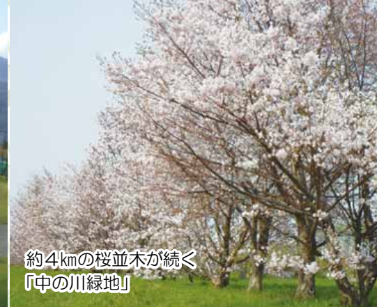
約4kmの桜並木が続く「中の川緑地」