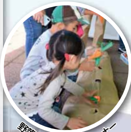
野菜もぎもぎ体験コーナー