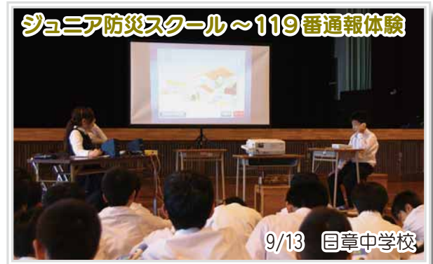
ジュニア防災スクール～119番通報体験