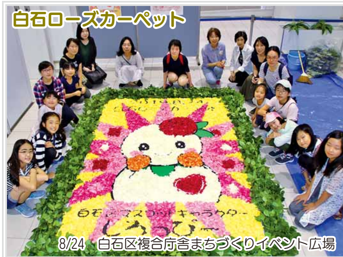
白石ローズカーペット

白石区の人口・世帯数 ※令和元年9月1日現在 人口 212,366人 (+53) 世帯数 110,337世帯 (+46)