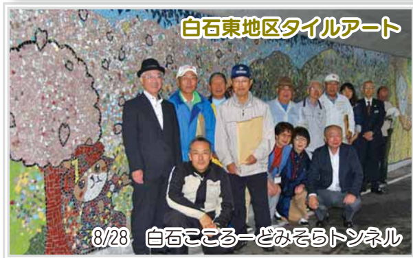
白石東地区タイルアート