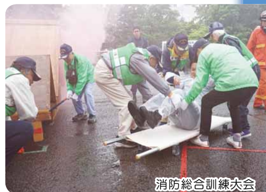
消防総合訓練大会

日頃から訓練をしていましたが、実際に地震が起こると思うようにいきませんでした。もっと具体的な状況を想定しながら、 情報の収集・連絡体制の見直し などを進めていきます。