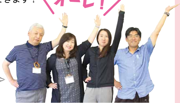
リハメンコ体操を考案した介護予防センタースタッフの皆さん

厚別区には、他にも下半身を中心に鍛える「 らくしょう楽笑体操 」があります。こちらも介護予防教室などのプログラムに取り入れられ、親しまれています。