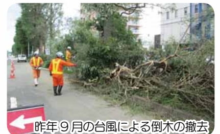
昨年9月の台風による倒木の撤去

厚別区や白石区、北広島市に所在する事業者で構成されています。災害時には、道路や河川の点検、応急対応といった区民生活の安全に欠かせない活動を行います。