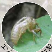
エゾハルゼミの抜け殻

この緑地には他に、エゾゼミやコエゾゼミ、キツツキの仲間であるアカゲラやヤマゲラなどが生息しており、姿は見えなくても、その痕跡を垣間見ることができます。