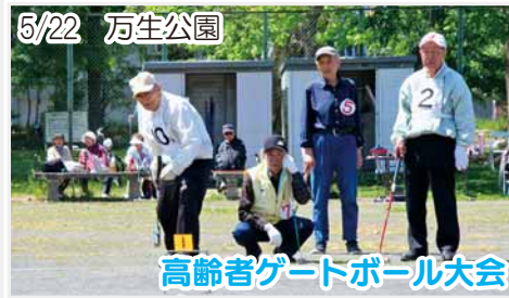
高齢者ゲートボール大会