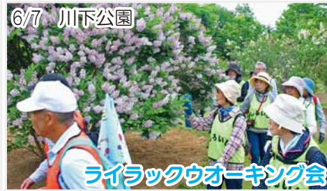
ライラックウオーキング会