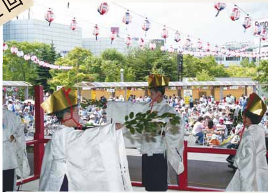
近隣市交流ステージがスタート のっぽろだいたいから 写真は「野幌太々神楽」(江別市)