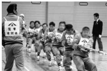
▲分区記念綱引き大会の様子。 大勢の参加者と観客で盛り上がりました。

白石区から分区した当時、記念として行われていた綱引き大会が復活! 両区のチームによる、勝利をかけた熱い戦いは必見です!