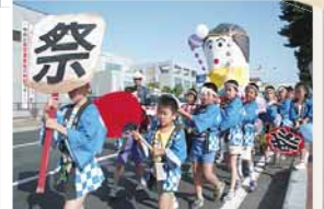
子どもたちのおみこし