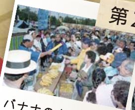
バナナのたたき売り

およそ7万人の来場者数や、 町内会連合会・自治連合会に よる充実した出店、まつりを 継続する地域の熱意は、私の 知る中で最大の地域イベント です。どの回もとても印象に 残っています。