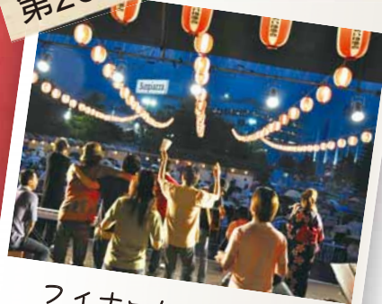
ファイナーしに向けて 会場は一体に!!