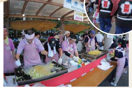
出店やステージ、会場警備など、 地域の方が支えています