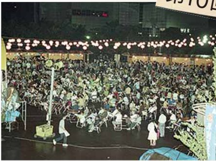
およそ9万8千人が来場