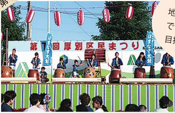
「厚別本陣はまなす太鼓」の演奏 厚別区初の和太鼓チームとして現在も出演