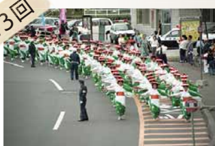
大規模なパレードも