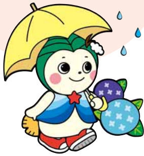
北区まちづくりキャラクター 「ほっぴい」