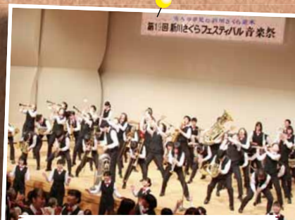
5/11 新川さくらフェスティバル音楽祭～札幌サンプラザ