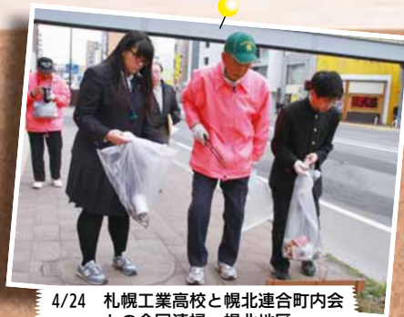
4/24 札幌工業高校と幌北連合町内会との合同清掃～幌北地区