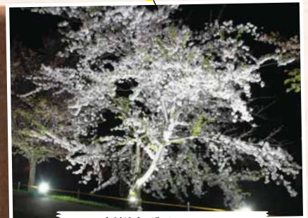
5/3 新川夜ざくら 2019 ～新川さくら並木 (一部)