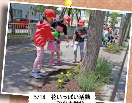
5/14 花いっぱい活動～和光小学校