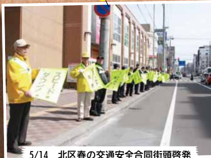
5/14 北区春の交通安全合同街頭啓発～北 24 条交差点周辺ほか