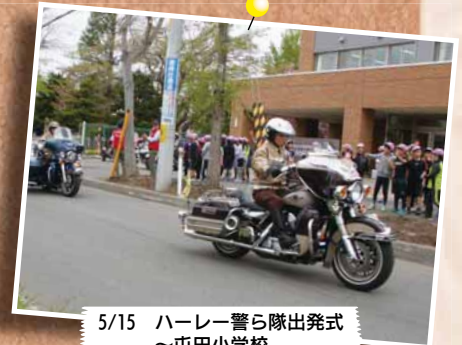
5/15 ハーレー警察隊出発式～屯田小学校