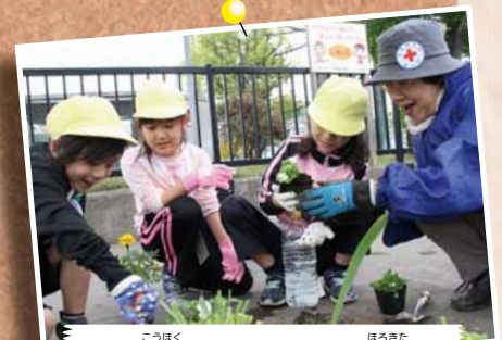
5/15 幌北小児童と日赤奉仕団幌北分団の花植え～幌北小学校