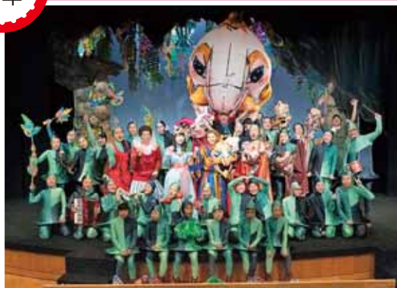
30周年記念制作野外巨大人形劇「テンペスト」