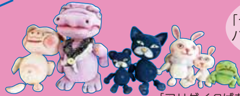
中高生を対象にした「やまびこ座・こぐま座パペットユーススクール」高校生の作品