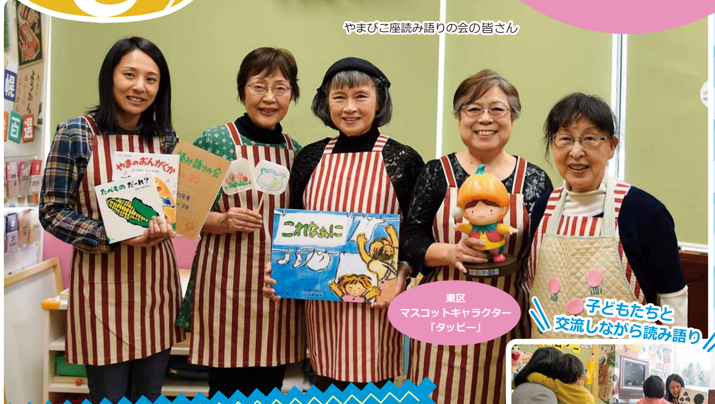
東区 マスコットキャラクター 「タッピー」