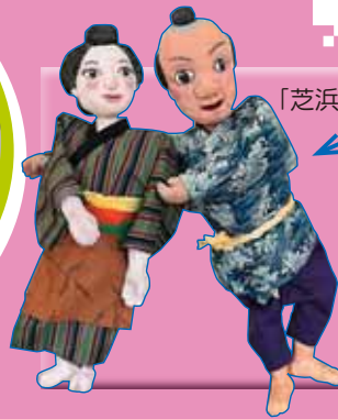
「芝浜」(第47回札幌人形劇祭子ども部門最優秀賞受賞)