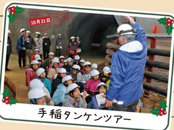
手稲タンケンツアー