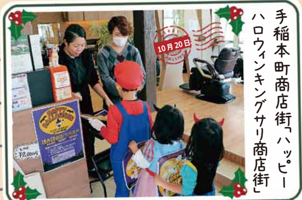
手稲本町商店街「ハッピー ハロウィンキングサリ商店街」