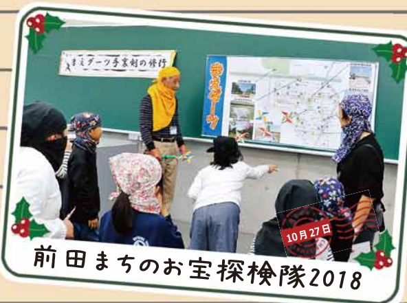
前田まちのお宝探検隊2018