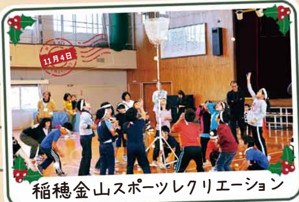
稲穂金山スポーツレクリエーション