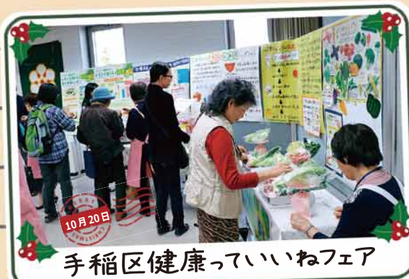
手稲区健康っていいねフェア