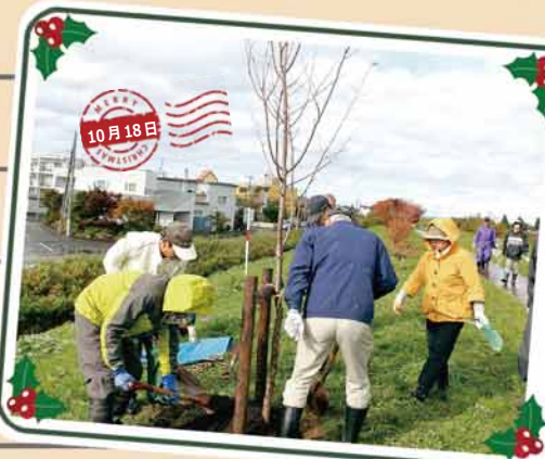
新発寒地区「桜の植樹会」