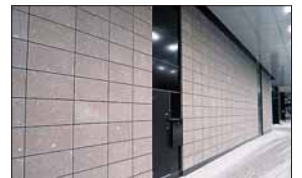
▲さっぽろ創世スクエア 1階車寄せの壁面