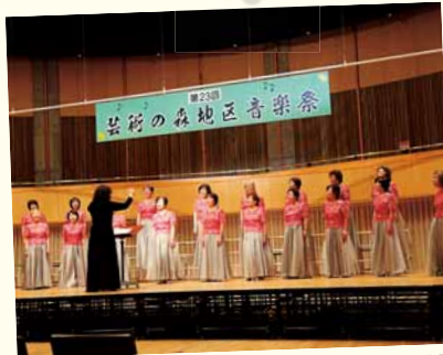
11/4 札幌芸術の森アートホール 第23回芸術の森地区音楽祭