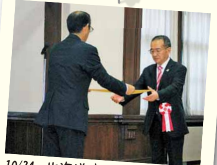
10/24 北海道庁 北海道社会貢献賞表彰式