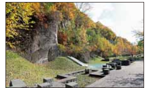
▲藻南公園札幌軟石ひろば

札幌軟石は大理石や御影石とは違い、独特な自然の温かみがあります。今後は壁材などとして需要が増えていくと思います。市内で軟石を使用した建物がもっと多く見られるようになるといいですね。