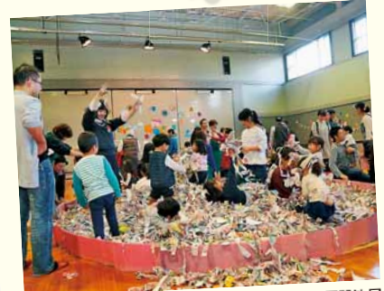
11/11 藤野地区センター ふじの子育てサロンフェスタ