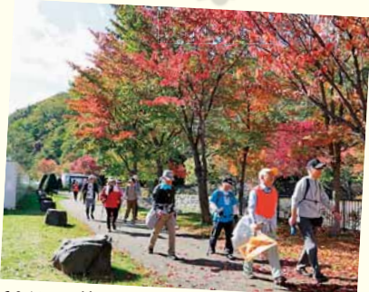
10/15 藻岩下地区 紅葉ウォーキング大会