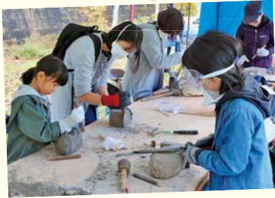
10/20、21 石山緑地 南区学生まちナカアート プロジェクト in 石山緑地