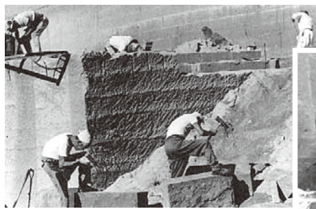
◀▼手作業で行われていた頃の採石の様子

開拓使時代から北海道の産業と暮らしを支えてきたこと、また、地域住民や保存会、企業などにより札幌軟石の文化が今も脈々と受け継がれている点などが評価され、北海道遺産に選定されました。