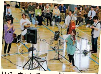
11/1 市立札幌みなみの杜 モリ 高等支援学校 みんなの杜コンサート