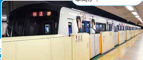
東西線のホームに東豊線車両のファイターズ号!

東豊線の車庫（西車両基地）は、東西線の二十四軒駅と西28丁目駅の間にあります。栄町駅から車庫に向かう地下鉄は、乗客を乗せずに「回送」となり、さっぽろ駅を過ぎて連絡線を通って大通駅と西11丁目駅の途中から東西線を走ります。