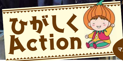
東区 マスコットキャラクター「タッピー」