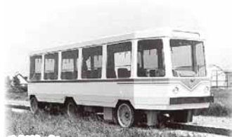
試験車 (昭和40年代初め撮影)