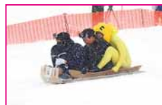
前回の優勝チーム