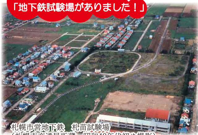
札幌市営地下鉄 札幌試験場 (札幌市交通局所蔵 昭和40年代初め撮影)