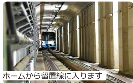
ホームから留置線に入ります