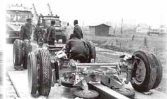
試験車の台車 (昭和40年代初め撮影)