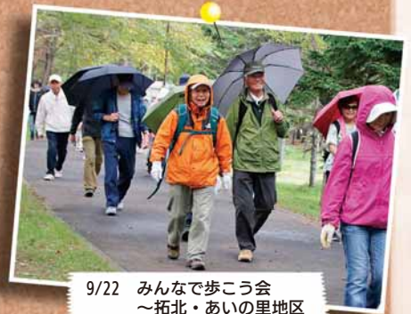
9/22 みんなで歩こう会 ～拓北・あいの里地区