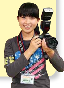
あなくら 穴蔵 記者

「子育てサロンに興味はあるけど、平日は仕事だから行けないな」と思っていませんか？「ちあふる・きた」では、毎月第3日曜日の10時～12時の間、「サンデーサロン」を開催しています。同世代の子どもたちと一緒に遊んでいる子どもの姿は、きっと新鮮でいろいろな発見があると思います。平日に子どもと遊ぶ機会の少ないお父さんなどは、ぜひ一度参加してみたいかがですか？お父さん同士の交流もできますよ。