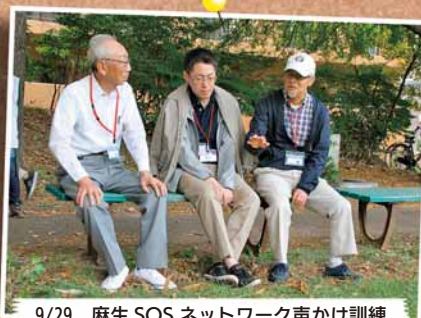
9/29 麻生SOSネットワーク声かけ訓練 ～麻生総合センターなど