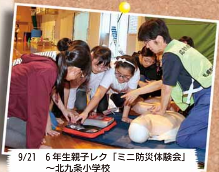
9/21 6年生親子レク「ミニ防災体験会」 ～北九条小学校