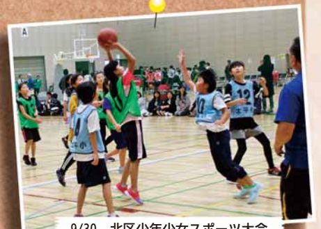
9/30 北区少年少女スポーツ大会 ～北区体育館など