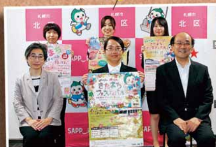
9/13 「ほっぴいはっぴいきたまちフェスティバル」PRポスター優秀者表彰式～北区役所