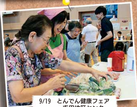
9/19 とんでん健康フェア ～屯田地区センター