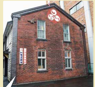
工場と同時に建てられた試験室です。「コバン味噌」「トモエ醤油」のほうろろ看板が、歴史を感じさせます。