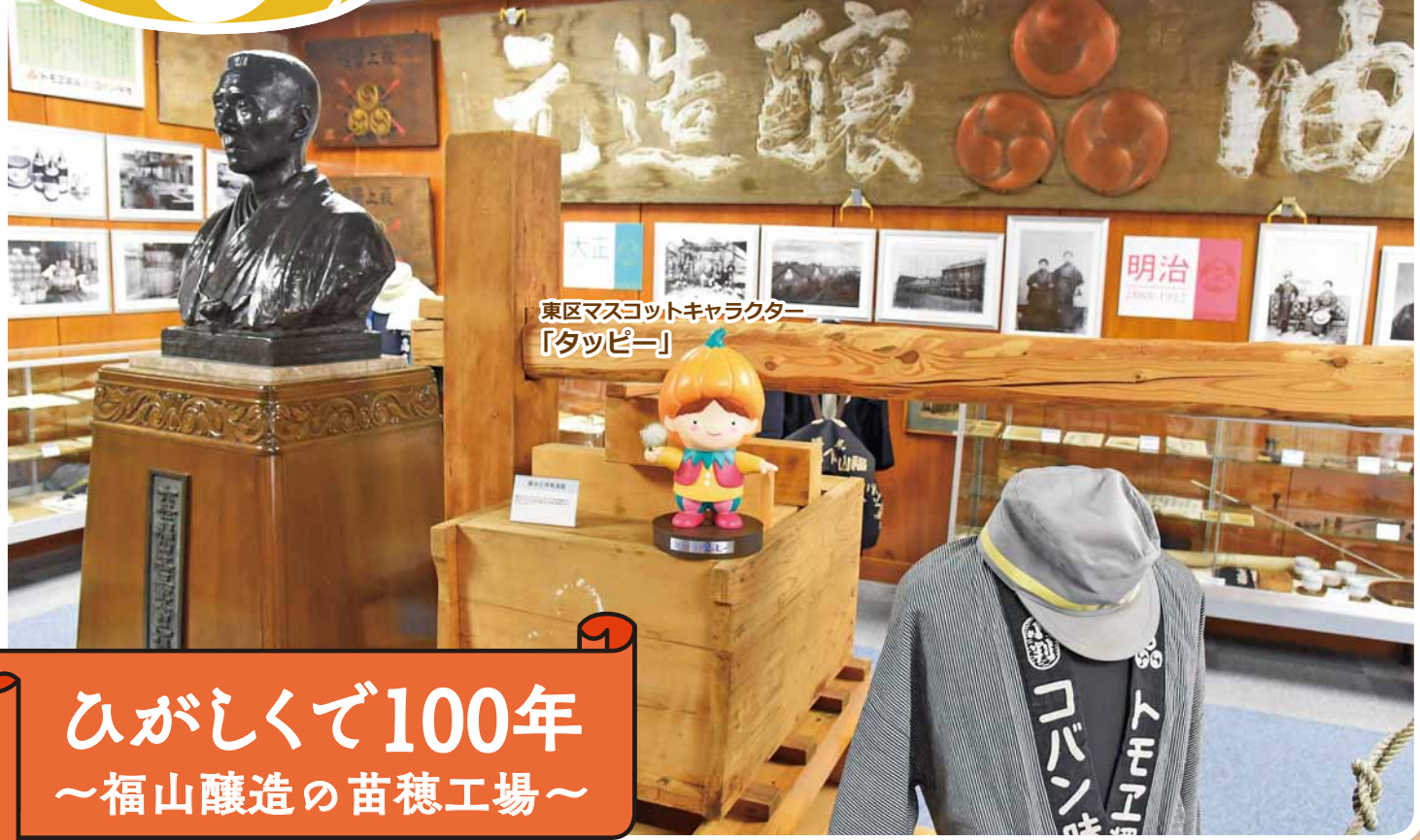
東区マスコットキャラクター「タッピー」