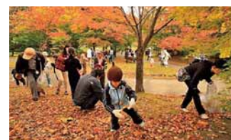
▲熊の沢公園森のレンジャー