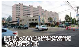
南郷通・大谷地駅前通の交差点 (大谷地東2 他)