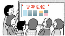
臨時掲示板(厚別区役所1階 他)