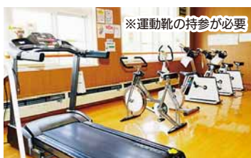
※運動靴の持参が必要

上野幌小学校の4階にあります。センター入口から直通エレベーターで4階まで直接お越しください。9時から21時まで無料で利用できるプレイルームには、ランニングマシンとエアロバイクを備えています！仕事帰りや休日など、健康づくりにご活用ください。