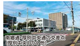
南郷通・厚別中央通の交差点 (厚別中央1の4 他)