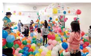
▲もみ人ふれあい祭り

もみじ台の中心にあり、子どもから高齢者まで楽しむことができるセンターです。約40のサークルが日々活動している他、ステージ発表や出店で大にぎわいの「もみ人ふれあい祭り」、自然を学び守る「熊の沢公園森のレンジャー」など、センター主催のイベントを多数開催しています。