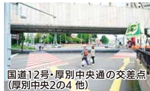
国道12号・厚別中央通の交差点 (厚別中央2の4 他)