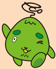
西区環境キャラクター さんかくやまベエ