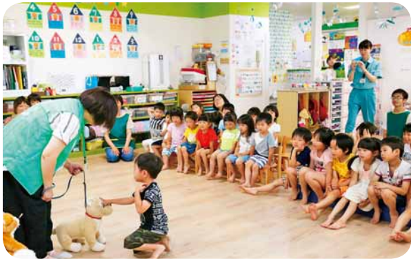
▲どうぶつあいご教室(認定こども園森のタータン保育園園の沢)犬を怖がらせない触り方を教えています！