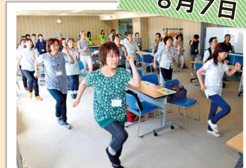
みんなで一緒に介護予防!