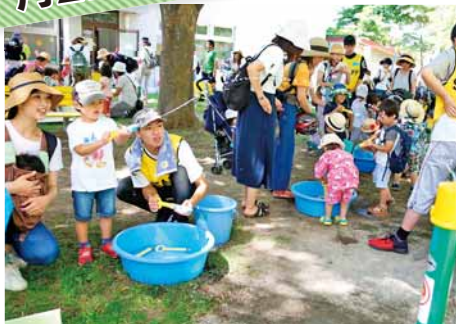
おまつりには笑顔がいっぱい

西保健センター（琴似2-7）で開催された乳幼児向けイベント「夏だ!さんかくやまベエまつり」。水遊びや手作りゲームなどに子どもたちは大はしゃぎ。500人を超える親子らが来場し大盛況でした。