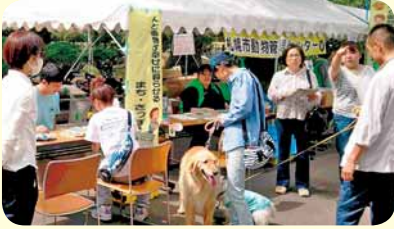
▲平成29年度の「どうぶつの本の世界」(上)と愛護イベント(下)の様子