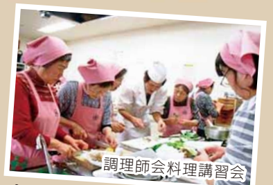
調理師会料理講習会