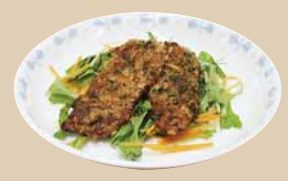
▲サンマのパン粉焼き

「あつべつ健康ランチ（通称：AKL）」とは、厚別保健センターの栄養士が考えた野菜たっぷり塩分控えめのヘルシーメニューです。