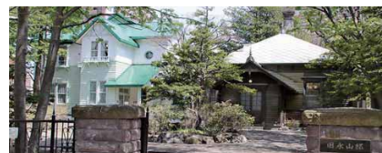
▲明治10年代に建てられた第2代北海道庁長官・永山武四郎の私邸(右)と、昭和12年ごろ増築の旧三菱鉱業寮(左)