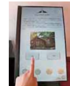
▲画面にタッチすると、市の文化財の見どころなどが閲覧できる電子パネルも!

▼旧三菱鉱業寮の2階にあるギャラリーでは、市の文化財をパネルで紹介するほか、企画展示も実施する予定