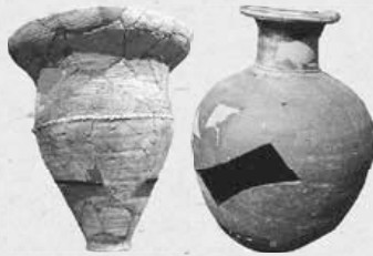
◀北区北18条エルクムトンネル周辺の遺跡から出土。擦文土器(左)と須臾器(右)

木のへらでつけられた文様が特徴的なかめ型の土器。同じ遺跡から、本州で作られた陶質の土器も見つかり、交流があったことが分かる。