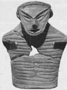
▲▶西区二十四軒の遺跡から出土

地面に穴を掘って作ったお墓から出土した土偶。底からは2列に並んだ状態のサメの歯が見つかり、当時の死者の埋葬に使われていたと思われる。