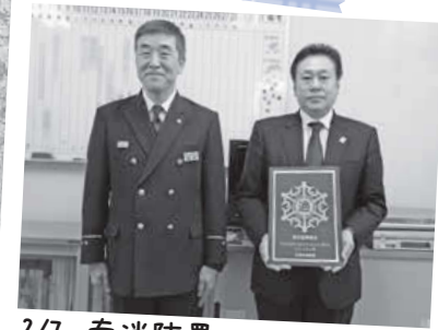
2/7 南消防署 南消防署が宿泊施設に表示マ ーク(金)を交付