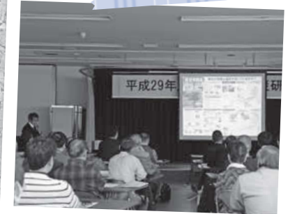
2/28 真駒内総合福祉センター 南区地域防災研修