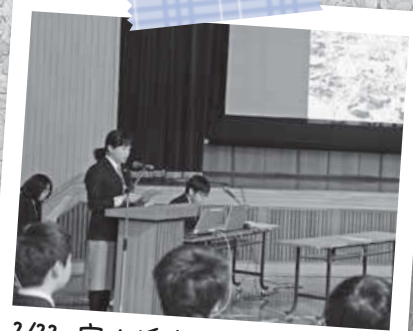
2/22 定山溪中学校 森づくり活動発表会