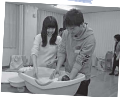
2/23 南保健センター 両親教室