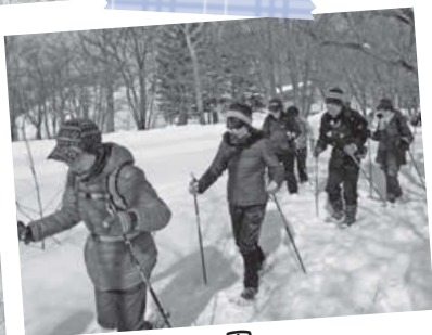
2/8 真駒内公園 スノーシュー(西洋かんじき) ウォーキング大会