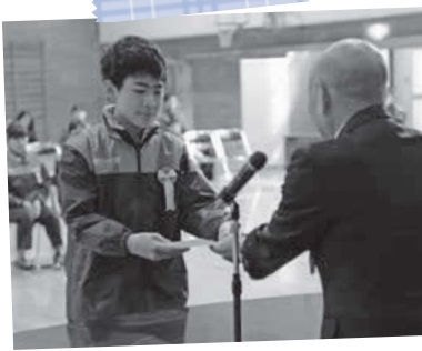
2/24 真駒内桜山小学校 南区少年消防クラブ合同卒団式