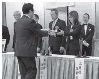
2/14 ホテルライフォート札幌 札幌市民スポーツ賞贈呈式