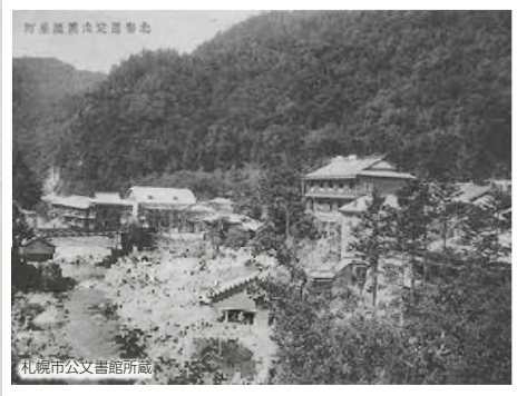
▲大正後期の定山溪温泉

慶応2(1866)年、僧侶の定山(後に美泉定山と改名)は源泉を確認し、湯治に使う仮屋を建設。温泉自体は既に発見されていたが、本格的に開発に取り組んだのは定山だった。その姿勢に感動した東久世開拓長官により明治4(1871)年に定山溪と名付けられた。