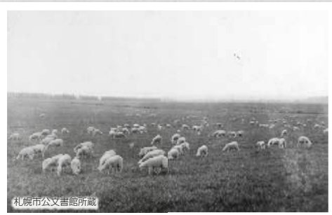
参考:「1 札幌地名考」(昭和52年刊)、「59 定山溪温泉」(平成3年刊)。いずれも「さっぽろ文庫」(札幌市が発行)