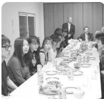
▲改修した施設で開催された留学生交流会

内 地域の課題を解決するために空き家や町内会館などを整備して行うまちづくり活動の