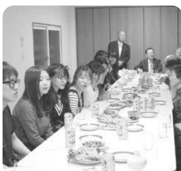
▲改修した施設で開催された留学生交流会

内 地域の課題を解決するために空き家や町内会館などを整備して行うまちづくり活動の