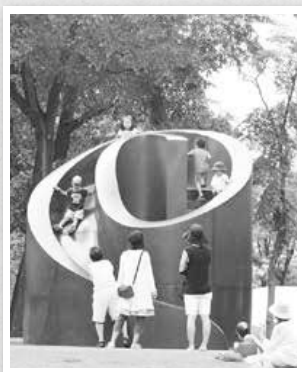
▶雪景色にも映える黒い滑り台の彫刻「ブラック・スライド・マントラ」

彫刻家のイサム・ノグチは道路で分断されていた8丁目と9丁目をつなげ、子どもたちの遊び場にするを提案。滑り台の彫刻の設置を計画し、「子どもたちの尻がこの作品を完成させる」と語った。