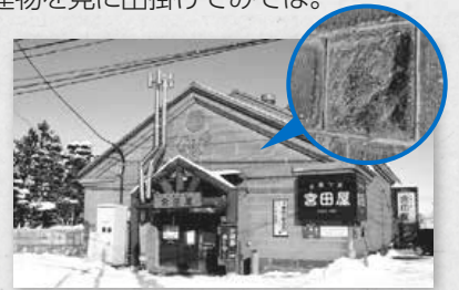
旧沼田家倉庫 (豆蔵珈房宮田屋 東苗穂店) 昭和37(1962)年建築 札幌景観資産第30号 住所・見学 東区東苗穂5の2。1/1(祝)を除く 10時~24時。喫茶店利用時のみ内覧可