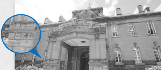
札幌市資料館(旧札幌控訴院) 大正15(1926)年建築 札幌景観資産第17号、国登録有形文化財 住所・開館時間 中央区大通西13。月曜(祝日の場合はその翌平日)と年末年始を除く9時~19時

かつて札幌控訴院であり、現在は美術作品の発表の場などとして活用されている資料館は、札幌軟石を使った現存する建物としては市内最大。軟石でできた外壁が特徴的です。