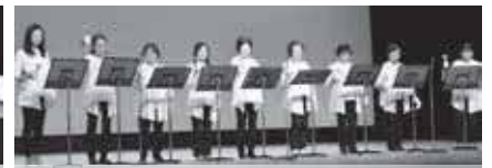
ハンドベルで「ムーンリバー」を演奏