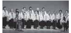
民謡「秋田おぼこ」を披露