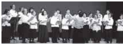
「あの鐘を鳴らすのはあなた」を合唱