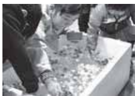
～スーパーボールすくい～