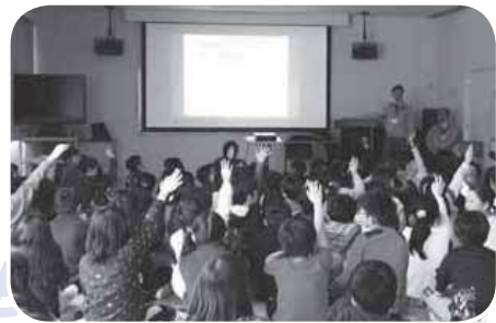
◀クイズを交えながら学習しました

土木センターの協力の下、授業では除排雪の大切さとその仕組みについて学びます。児童からは「お金もかかるし本当に大変な仕事なんだな」という声が聞かれ、理解が進んでいるようです。こうした地域の課題について考える機会を通じて、将来子どもたちが社会参画していくための芽を育てていければと考えています。