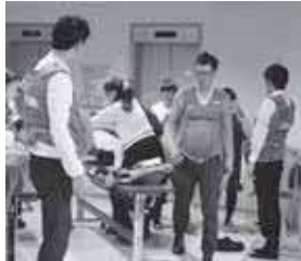
重りを付けて妊婦体験