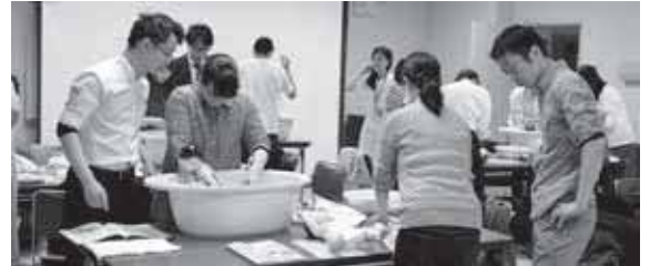
沐浴や着替えを練習