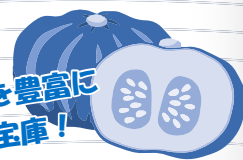
ビタミン類を豊富に含む栄養の宝庫！

手稲山口地域で栽培されたスイカは、糖度が高く「サッポロスイカ」として親しまれています。そのスイカ作りの技術を生かし、冷害に弱いスイカを補完する作物として栽培されるようになった、強い甘みとホクホク感が人気のカボチャの名前と言えば？