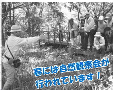
春には自然観察会が行われています！