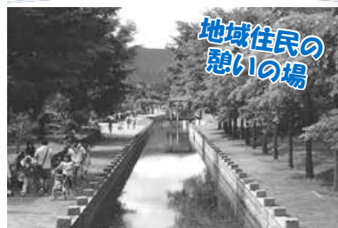
地域住民の憩いの場

現在は水辺の散歩道となっていますが、明治30年代に、手稲山口地域の排水と農産物や生活物資の水上輸送に利用され、当時全長6.5kmあった人工の川と言えば？