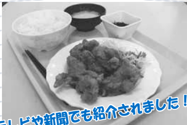
テレビや新聞でも紹介されました！

リーズナブルな価格で、味とボリュームに定評がある手稲区役所の食堂。日替わり定食やカレーなど、数あるメニューの中でも名物定食と言えば？