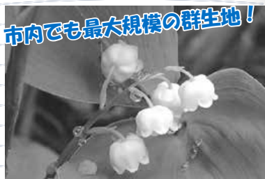
市内でも最大規模の群生地！

富丘西公園（富丘4-5～5-5）では、ある植物が自生しており、地域住民の保全活動により守られています。その貴重な自生植物の名前と言えば？