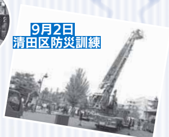
9月2日 清田区防災訓練