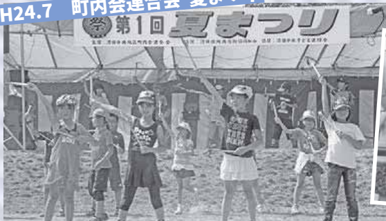
H24.7 町内会連合会 夏まつり

▲清田南公園で行う夏祭りは、この年に第1回を開催。前半は「子どもが主役」、後半は「大人の見せ場」のプログラムで、大いに盛り上がります。