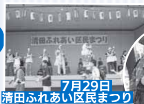
7月29日 清田ふれあい区民まつり