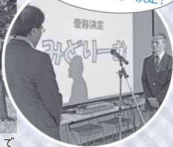
H27.7には 平岡樹芸センターの愛称が 「みどりーむ」に決定!

▶福祉のまち推進センターが「みんなが安心して暮らせるまち」を目標に、住民同士の情報交換と交流の場として毎年開催しています。