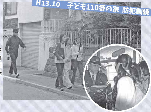
H13.10 子ども110番の家 防犯訓練

▶児童が身の危険を感じたときに、「子ども110番の家」へ駆け込み、助けを求めるこの模擬訓練で、万が一のときの対応方法を学びます。