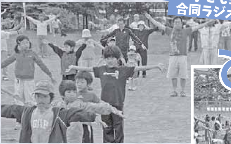
H20.7 子ども会 合同ラジオ体操

▲清田西公園で、小・中学校の夏休みの初日に行う合同ラジオ体操は、この年に初開催し400人が参加。すがすがしい太陽の光を浴びながら、みんなで元気いっぱい体を動かします。