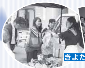
9月9日 きよたマルシェ&きよフェス