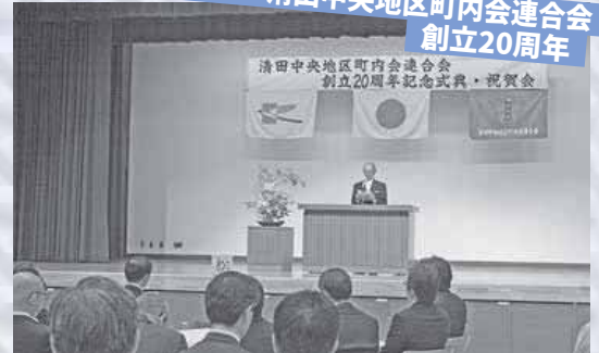
H22.6 清田中央地区町内会連合会 創立20周年

▲清田地区町内会連合会から独立し、この年に20周年。式典では、「安心して暮らせるまちづくり」に向けて、改めて気持ちを確認し合いました。