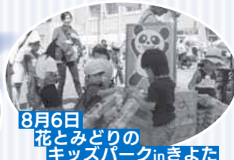
8月6日 花とみどりの キッズパークinきよた