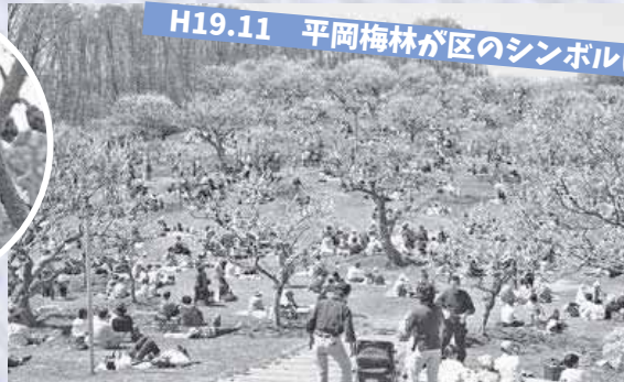
H19.11 平岡梅林が区のシンボルに

▲区誕生10周年を記念して「白旗山」「あしりべつ川」とともに、区のシンボルに選定。春には、きれいに咲き誇る紅白の梅を見ようと、多くの方が平岡公園を訪れます。