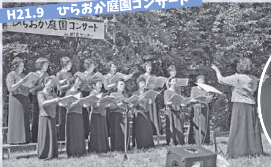
H21.9 ひらおか庭園コンサート

▲清田区ふるさと遺産の一つ、平岡樹芸センターでは、この年から緑豊かな庭園でコンサートを毎年開催しています。