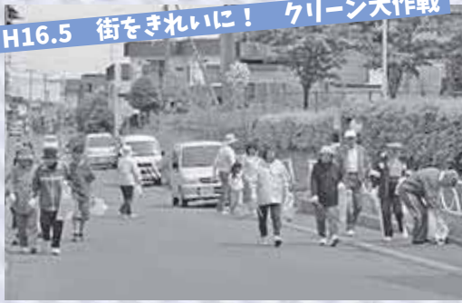
H16.5 街をきれいに！ クリーン大作戦

▶児童が身の危険を感じたときに、「子ども110番の家」へ駆け込み、助けを求めるこの模擬訓練で、万が一のときの対応方法を学びます。