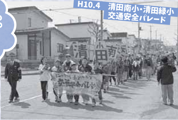
H10.4 清田南小・清田緑小 交通安全パレード

▶両校の児童や保護者らが地域へ交通安全を呼び掛けるパレードは、清田区が誕生する前から行われている、春の恒例行事となっています。