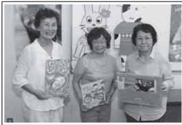
▲絵本読み聞かせの会「つくしんぼ」の皆さん