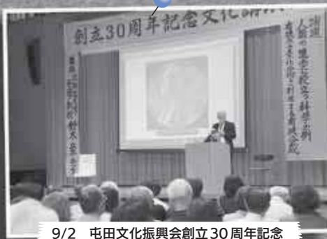
9/2 屯田文化振興会創立30周年記念 文化講演会～屯田地区センター