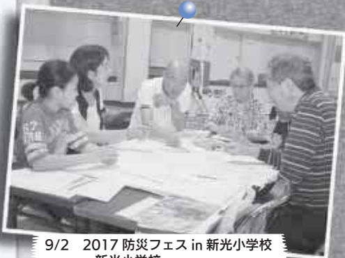
9/2 2017 防災フェス in 新光小学校 ～新光小学校