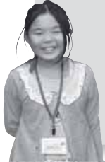
あきよし 秋吉 記者

新琴似図書館では、絵本読み聞かせの会「つくしんぼ」の皆さんが、幼児から小学生を対象に絵本や紙芝居の読み聞かせを行っています。また、10月には「秋のおたのしみ会」として、つくしんぼの皆さんが手作りした大型絵本の読み聞かせも行われます。その他にも、子ども向け・大人向け映画会、一日司書体験、寄席など、さまざまなイベントが新琴似図書館では行われています。詳しい内容については、きた7ページやホームページをご覧ください。