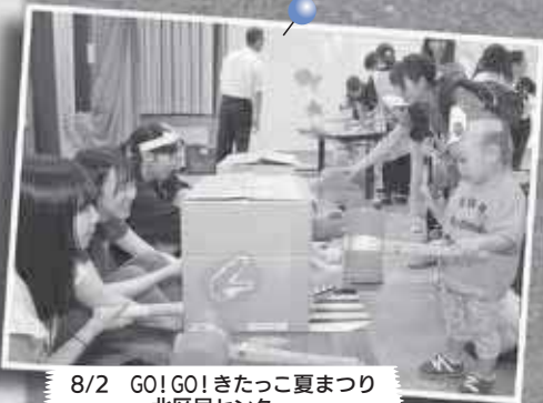
8/2 GO!GO!きたっこ夏まつり ～北区民センター