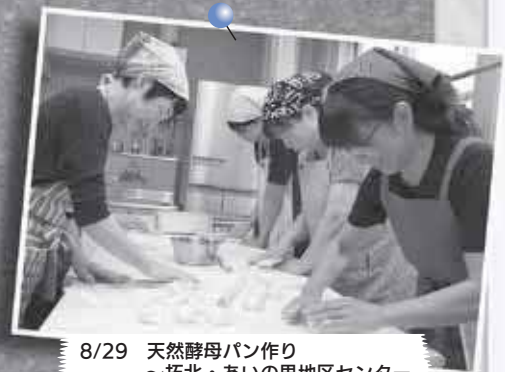
8/29 天然酵母パン作り ～拓北・あいの里地区センター