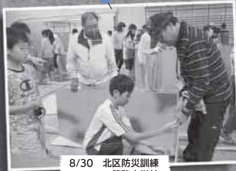
8/30 北区防災訓練 ～篠路小学校