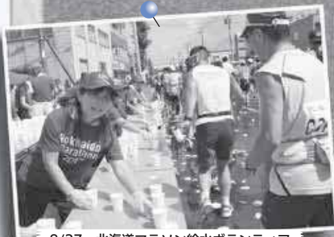
8/27 北海道マラソン給水ボランティア ～新川地区