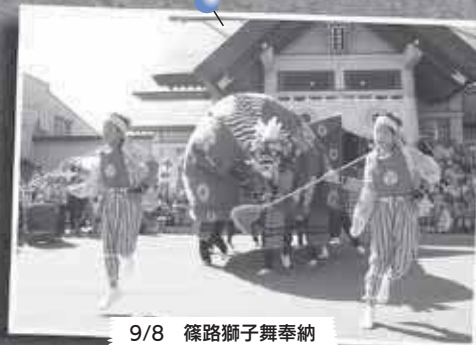
9/8 篠路獅子舞奉納 ～篠路神社