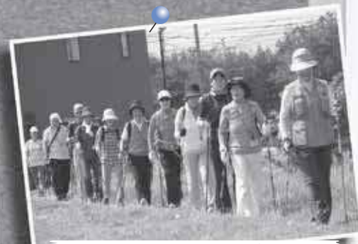
9/7 基本からしっかり！ノルディック ウォーキング講座～百合が原公園ほか